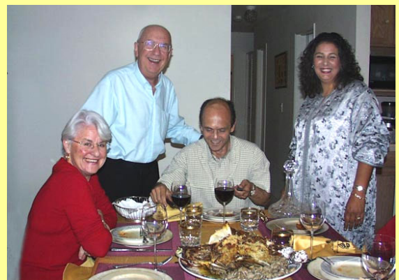
Un somptueux couscous chez des amis Marocains de Los Angeles