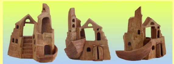
... franco- néerlandaise de L.A., dont voici une œuvre en terre cuite.