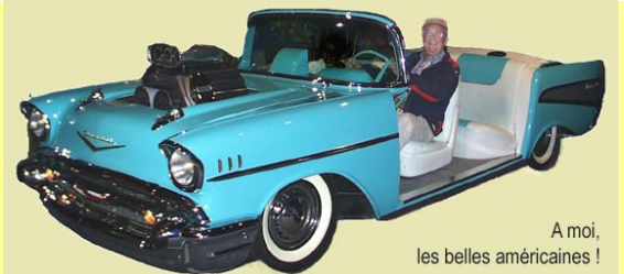
A moi, les belles américaines !